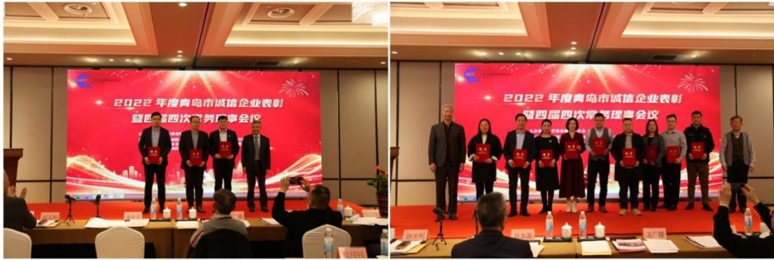
徐会长、孟会长、赵会长为新增补的副会长、常务理事颁发证书

今年，我们根据中宣部、国家商务部等十八部委文件精神，积极配合市商务局关于开展2022年“诚信兴商宣传月”活动，在全市企业中继续开展诚信建设工作，不断优化营商环境，营造诚信经营氛围，使诚信企业建设队伍不断壮大。2022年，有利群集团电子商务有限公司、青岛西海岸农高发展集团有限公司等125家符合条件的企业被评为2022年度市级诚信企业，另有青岛西海岸公用事业集团有限公司、青岛经济技术开发区国际贸易集团有限公司等9家企业荣获全国AAA级信用企业荣誉称号。截止到目前，全市共评选出市级诚信企业1275家（次），其中通过国家AAA级信用企业171家（次）。这项工作的有效开展，对于提升全市企业诚实守信意识，营造安全放心消费环境，优化营商环境，推动企业建立诚信管理体系起到了积极促进作用。