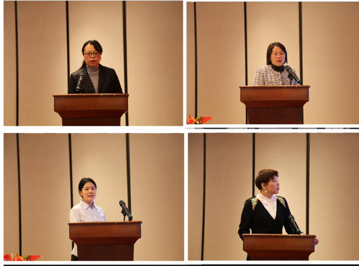
福昌食品、臻丰粮油、中国移动、国能等企业负责人做项目发布