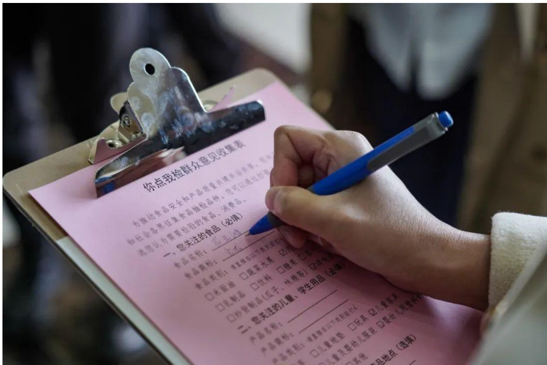
市民代表填写调查问卷

在琅琊台集团智能立体库，根据市民代表意见，抽样人员从库存产品中随机选取 4 批次样品进行抽样、封样，检验结果将通过省市场监管局官网向社会发布。