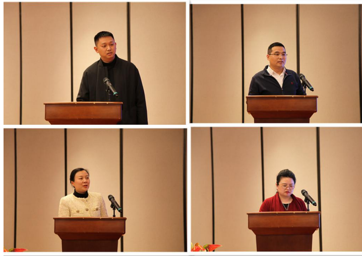
优特购、康德玖业、皇家食品、青西传奇等企业负责人做项目发布

最后，青岛市商业联合会会长、利群董事局主席徐恭藻发表讲话。徐会长指出，我们将深入贯彻学习党的二十大精神，进一步加强自身建设和行业自律，抓住发展机遇，遵守相关行业协会规定，切实履行各项职责，保障商会工作稳固发展；开展会员交流活动，集思广益，搭建多元化合作平台，实现共赢发展；精准把握行业动态，切实做好行业服务，提升商联会的社会影响力，不断壮大会员队伍。